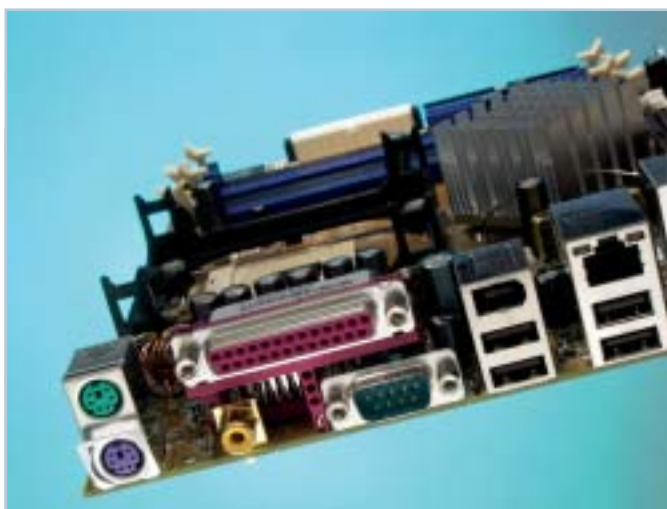
Uspořádání konektorů na základní desce se mění - sériový port nahrazuje S/PDIF konektor, častější je FireWire port a síťová karta.

Přehled zakončíme deskou QDI 41865PEA , která využívá sadu 865PE. Její vybavení je standardní – má pět PCI slotů, čtyři paměťové sloty a dva IDE a dva Serial ATA konektory. Z funkcí je zajímavá podpora IrDA rozhraní, možnost připojení S/PDIF panelu, který je i ve výbavě. Napětí není možné v BIOS měnit, nastavit lze pouze frekvenci sběrnice. Cena desky je zajímavá. ■ ■ ■ Pavel Trousil