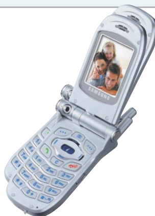
Поворотный дисплей: Samsung демонстрирует модель P400 — телефон-камеру.