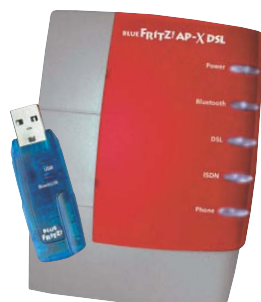
Высокая степень интеграции: новая разработка фирмы AVM — BlueFritz Access Point — это одновременно DSL-модем, ISDN-карта и адаптер для беспроводного интерфейса Bluetooth.