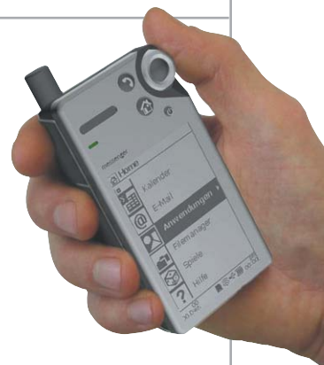
Смартфон и Linux: для управления этой умной вещицей служит небольшое колесико.