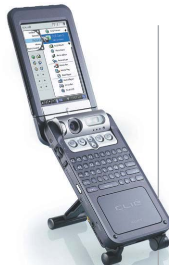
КПК с двухмегапиксельной камерой: Sony NZ90 с операционной системой Palm 5.0 и интерфейсом Bluetooth.