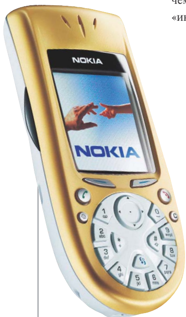
Ностальгия по телефонному диску: смартфон Nokia 3650 ошеломляет своим дизайном.

Интегрированные устройства подключения типа BlueFritz Access Point также имеют большое будущее, поскольку обеспечивают качественно новый уровень комфорта при работе в сетях.