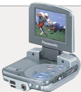
Комбинированное устройство «четыре в одном»: крошечный «микрокомбайн» SV-AV30 фирмы Panasonic объединяет в себе цифровую фотоаппарат, видеокамеру, MP3-плеер и видеопроектор.