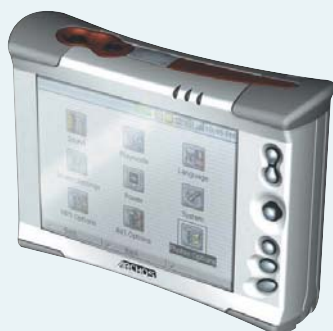
Мобильное кино: устройство типа AV340 может хранить на своем винчестере емкость 40 Гбайт почти 80 часов видеозаписей в формате MPEG-4.