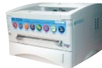
Brother LH 1250