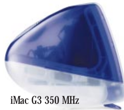
iMac G3 350 MHz

knjigovodstveni program prigodno s laserskim pisacem i računalom