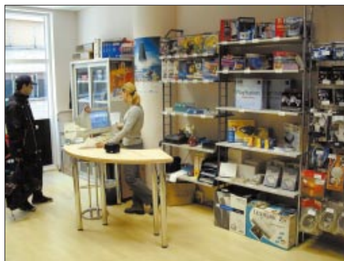
Formel u Importanneu U malom se prostoru na Iblerovom trgu nalazi velika IT ponuda

periferije, dodatnog pribora, multimedije, tinti, kabela, skenera, pisača, moguće je kupiti i gotove PC konfiguracije ili PlayStation konzolu. Odabrana lokacija gotovo da i nema konkurencije u tom dijelu grada, a svim je posjetiteljima trgovačkog centra osigurano parkirališno mjesto u podzemnoj garaži, što će novu Formelovu trgovinu učiniti još pristupačnijom. (KM)