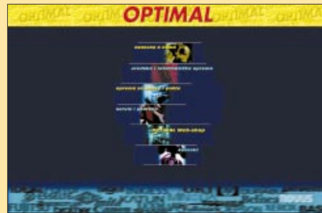
Optimal na Internetu Ponuda papira za profesionalnu uporabu

omota za medije, podloški za miša i slično. Velika je novost posjetnica izvedena kao mini CD-ROM zanimljivog oblika kojim možete promovirati svoju tvrtku ili sebe osobno. Detaljnije informacije na www.optimal.hr .