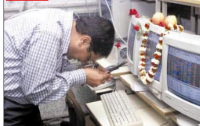
Klanjanje računalu Indijski broker klanja se svom online osobnom računalu na burzi dionica u Calcutti. Indijsko tržište trenutačno doživljava veliku ekspanziju, a ministar financija Yashwant Sinha uvjера inozemne ulagače da mogu imati povjerenja u njihov ekonomski sustav i da će se obuzdati trenutačni financijski deficit. (RG)