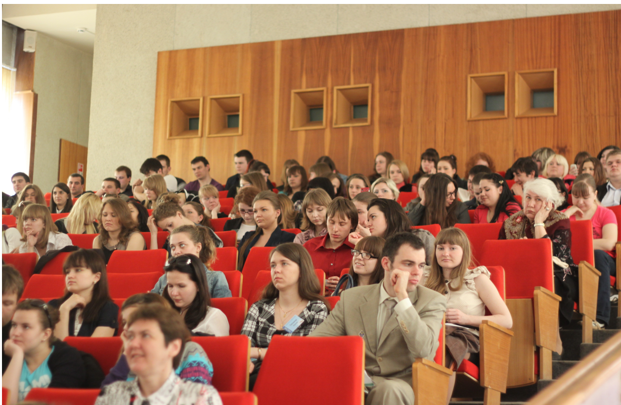
Участники Восьмой Международной молодежной научно-практической конференции «Политика и бизнес в меняющемся мире»