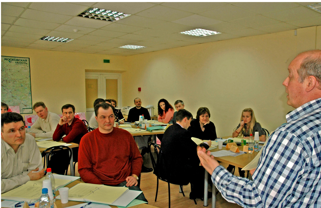
Рабочий момент программы дополнительного профессионального образования «Управление малыми инновационными предприятиями и проектами».