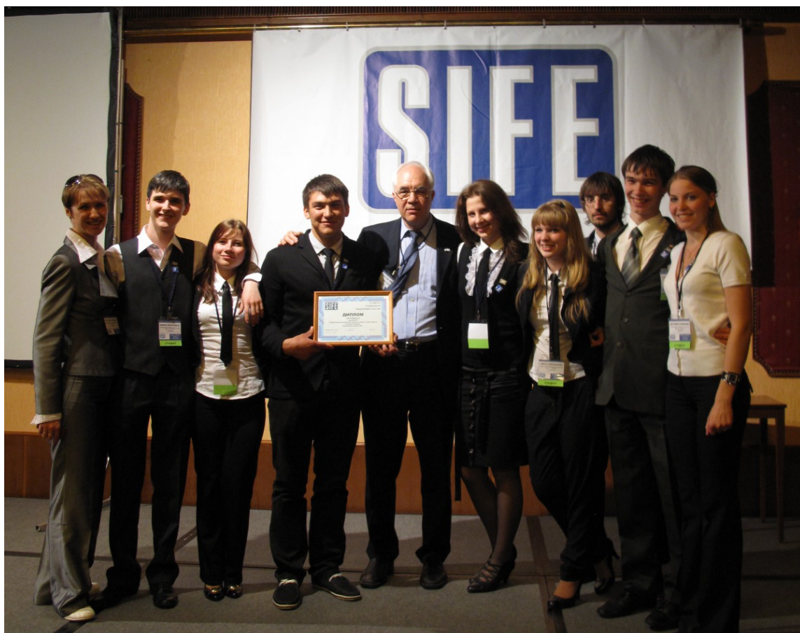
Вручение диплома команде Филиала ГУУ за I место во Всероссийском конкурсе SIFE (Студенты в свободном предпринимательстве).