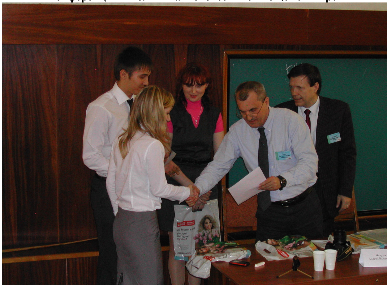
Вручение призов за лучший доклад на Восьмой Международной молодежной научно-практической конференции «Политика и бизнес в меняющемся мире»