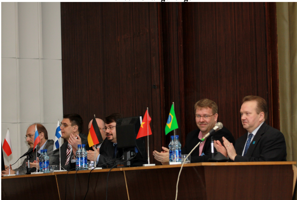
Открытие Седьмой Международной молодежной научно-практической конференции «Политика и бизнес в меняющемся мире».