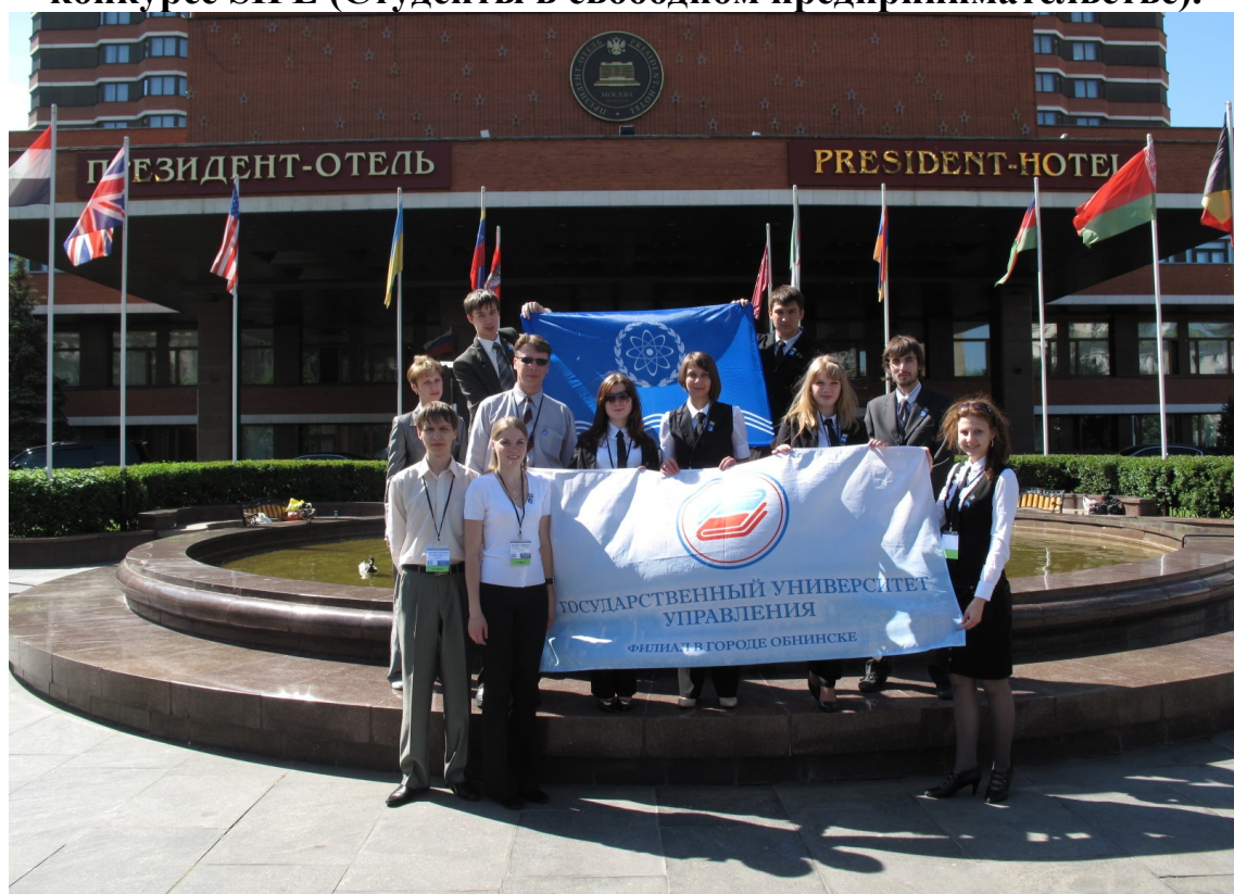
Команда Филиала ГУУ на Всероссийском конкурсе SIFE (Студенты в свободном предпринимательстве)