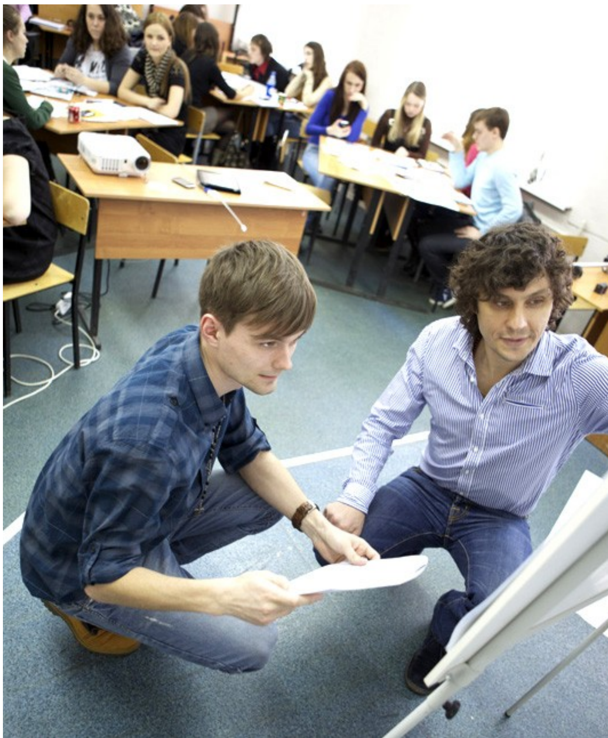
Мастер-класс преподавателя Стокгольмской школы экономики для студентов Филиала ГУУ