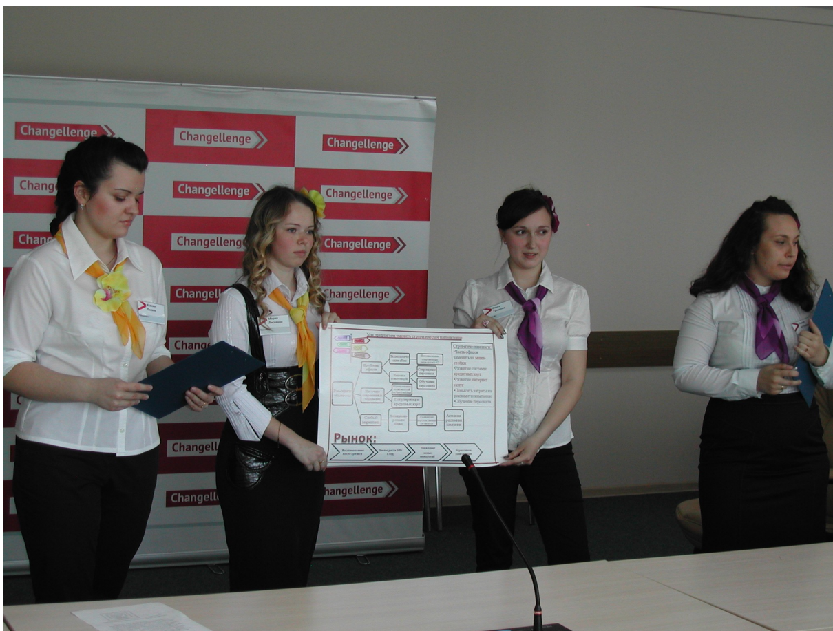
Команда ОФ ГУУ в финале всероссийского конкурса по решению бизнес-кейсов Changellenge