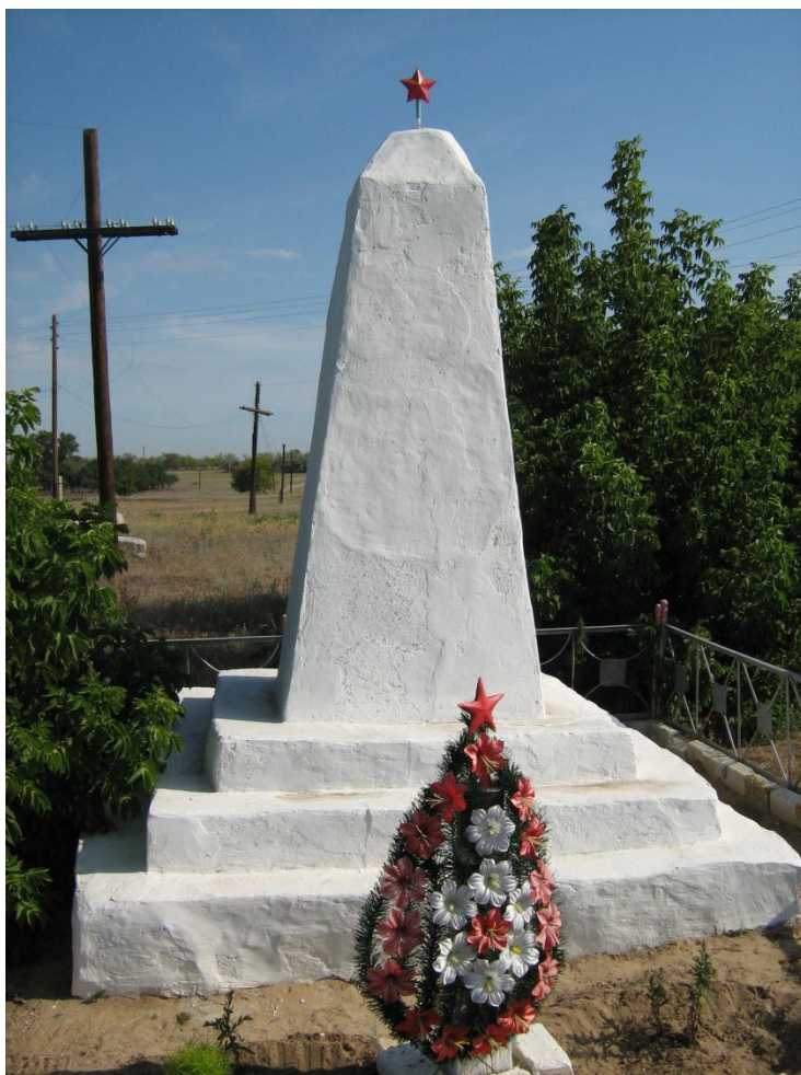
Братская могила советских воинов, погибших в период