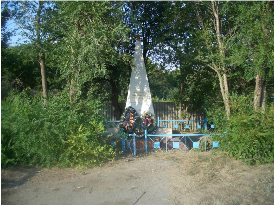
Памятный знак Ермаку Тимофеевичу от донских казаков, установлен в станице Качалинской.