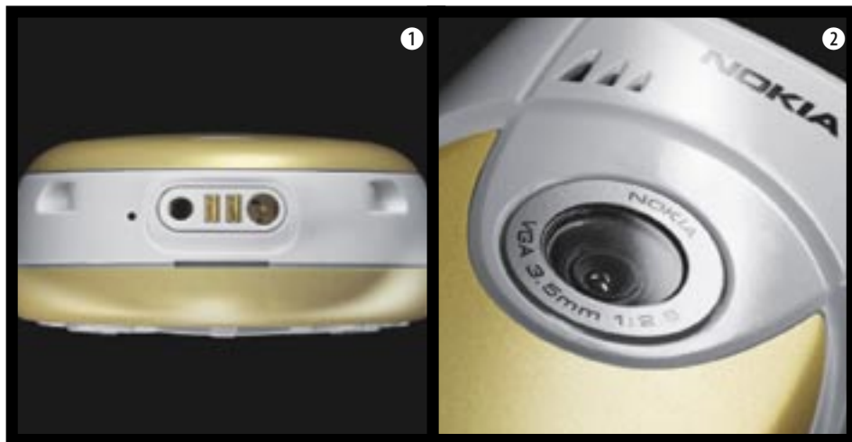
1 ani Nokia 3650 bohužel nemá datový konektor 2 na zadní straně telefonu je kamera

hlasitě handsfree. Vyzvánění je vícehlasé, telefon zvládá bez problémů přehrávat počítačové soubory MIDI.