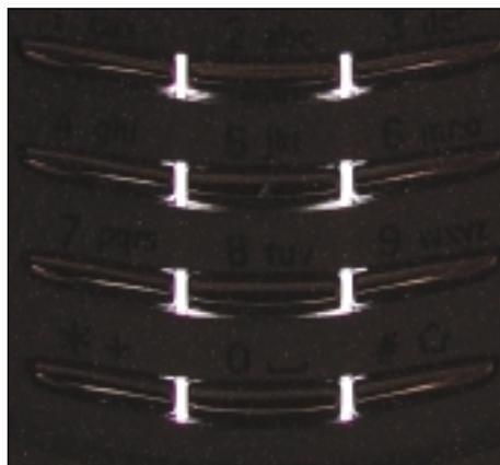
Podsvětlení tlačítek skutečně není ideální

S Bluetooth kartou Nokia by měla fungovat také komunikace s programy v balíčku PC Suite, s produkty jiných firem (3Com, Mitsumi apod.) se o to ani nepokoušejte. Zapomeňte také třeba na synchronizaci dat telefonu s počítačem, na kterém jsou Windows XP. Nokia zkrátka tento aktuální systém nepodporuje. Není to trochu zvláštní?