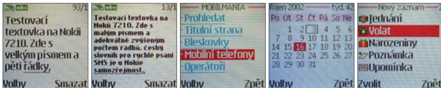
Zajímavé displeje: pro práci s textovými zprávami lze zvolit mezi dvěma velikostmi písma • wapový prohlížeč • měsíční pohled na kalendář • možné položky v kalendáři