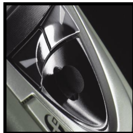
Joystick mohl být lepší

Nokia 7650 není funkčně vybavena tak, jak bych si osobně přál. Naštěstí používá operační