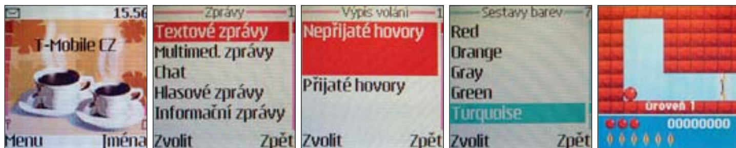
Zajímavé displeje: pohotovostní displej s obrázkem v pozadí • menu druhé úrovně • na některých místech menu trochu plýtvá místem • prostředí nemusí být jen červené jako na předchozích obrázcích • Bounce je skvělá hra, kterou Nokia po Communicatorech a modelu 7650 nabízí i pro model 7210

Novinkou je rychlá volba dvou, podle Nokie nejpoužívanějších funkcí: levou šipkou se z pohotovostního stavu dostanete hned do editoru textových zpráv, pravou šipkou do kalendáře. V mém případě se výrobce výběrem funkcí celkem trefil, mnohem lepší by ale bylo,