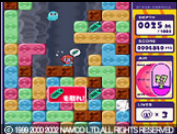
取れそうで取れない空気。取らなきゃアウトだが.....。