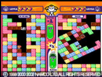
PC上で対戦モード! 見やすいのがスバラシイね

大人気のアクションゲーム『ミスタードリラー』の第2弾が、ついにPCHOMEとなって登場! 今回も謎のブロックが大量に発生し、地底まで掘り進むことになったススムくん。そこに、もう1人のドリラー・アンナが現れた!!今回は、ススムVSアンナで対戦だってできるぞ! LANを使えば、離れたところでだって対戦できるのだ! 様々なアイテムを駆使して、戦おう! もちろん1人プレイだって充実だ! 500m・1000mのコースに加え、特大ボリュームの2000mコースが登場!! それに「タイムアタックモード」と「とことんドリラーモード」も加わったのだ。シンプルな操作とルールは相変わらず健在。使用するのも、方向キーと、掘るボタンのみ。1人の時も、2人でも、掘って掘って掘りまくるのだ!