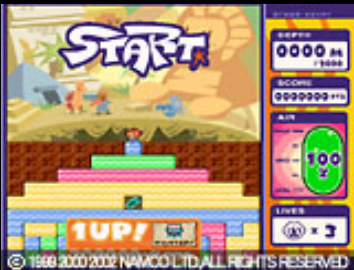
本邦初公開の2000Mモード。さぁ、気合をいれて掘り進もう!!