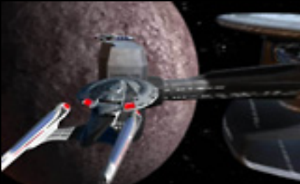
サイバーフロント

登場するユニットは実に多彩。『スタートレック』シリーズのファンなら、思わずニヤリとしてしまうものばかりだ。