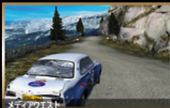
メディアクエスト

ハンドル操作の小さなミス一つが命取りに! 過酷なレースでは、わずかなミスもゆるされないのだ。