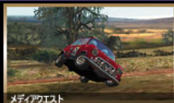
メディアクエスト

ハンドル操作の小さなミス一つが命取りに! 過酷なレースでは、わずかなミスもゆるされないのだ。