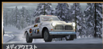
メディアクエスト

60年代、70年代のネオクラシックな名車たちのドライビングフィールをドゥプリ堪能させてくれるラリーレースシミュレーション。「ランチャ ストラトス」「ミニクーパース」など11種類の車種の中からお気に入りの選択、自分色に思いきりカスタマイズ、最適・バツグンの状態に仕上げてレースに挑むのだ。「Championship」では、ロシア・ケニア・フィンランド・スウェーデン・スイスといった世界各地を舞台にレースが行われる。19人いるライバルに走り勝ち、6位以内でチェッカーフラッグを受けるのだ! そうしなければ次のラリーへ進めないぞ。「Single Race」ではチャンピオンシップの舞台となるコースから望みのコースを選択する。最大6人が順番にプレイすることができて、タイムを競うのだ。「Arcade」は特別に用意されたサーキットを舞台に、コンピュータが操る5人のドライバーと激闘を繰り広げるぞ。このモードではライバルをコース外に押し出すことも可能! 文字通りホンキのバトルなのだ! 全部で42に及ぶコース、これらのすべて勝ちぬくためには、卓越したドライビングテクニックと車のあらゆる挙動を感じ取る、研ぎ澄まされたセンスが必要だ!!