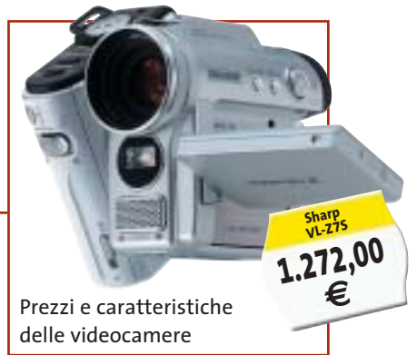
Prezzi e caratteristiche delle videocamere