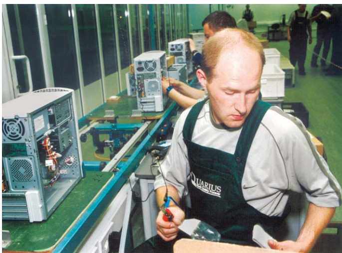
▲ Теперь в цехах «Аквариуса» будут собираться компьютеры HP