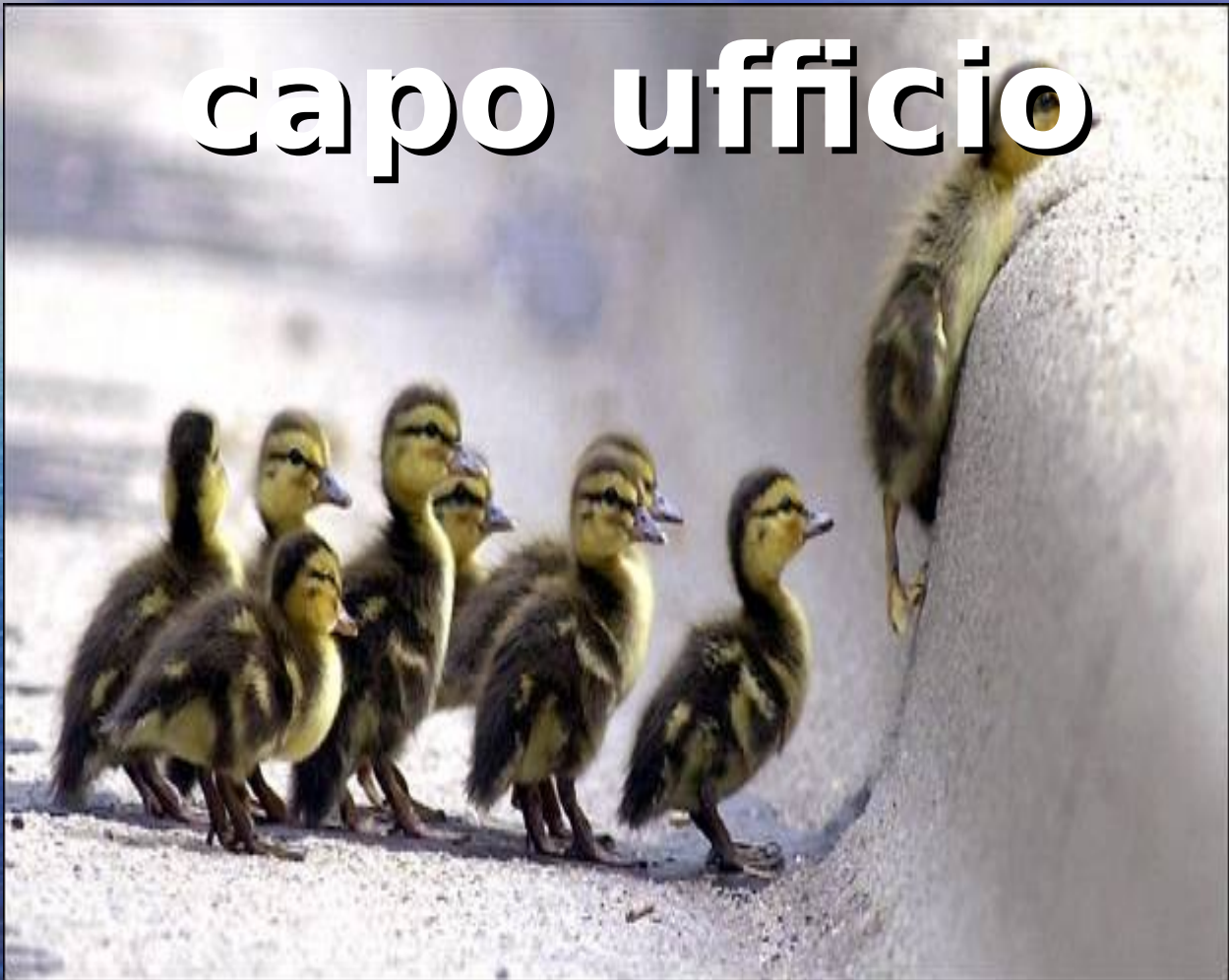
Jim Rider / South Bend Tribune