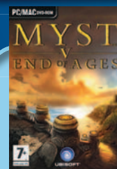
DVD igra MYST 5 End of ages