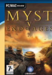
DVD igra MYST 5 End of ages