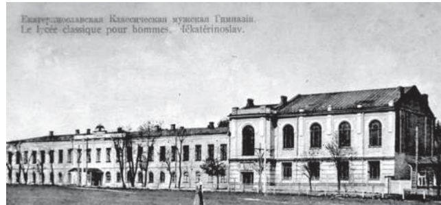
Будинок Дніпропетровського державного медичного університету. Le lycée classique pour hommes. (Катеринівськ).

1989 рік. Професійна майстерність ансамблю постійно зростає. Шановані і знані на «рівні професіоналів» колектив «Дніпровських зорь» був